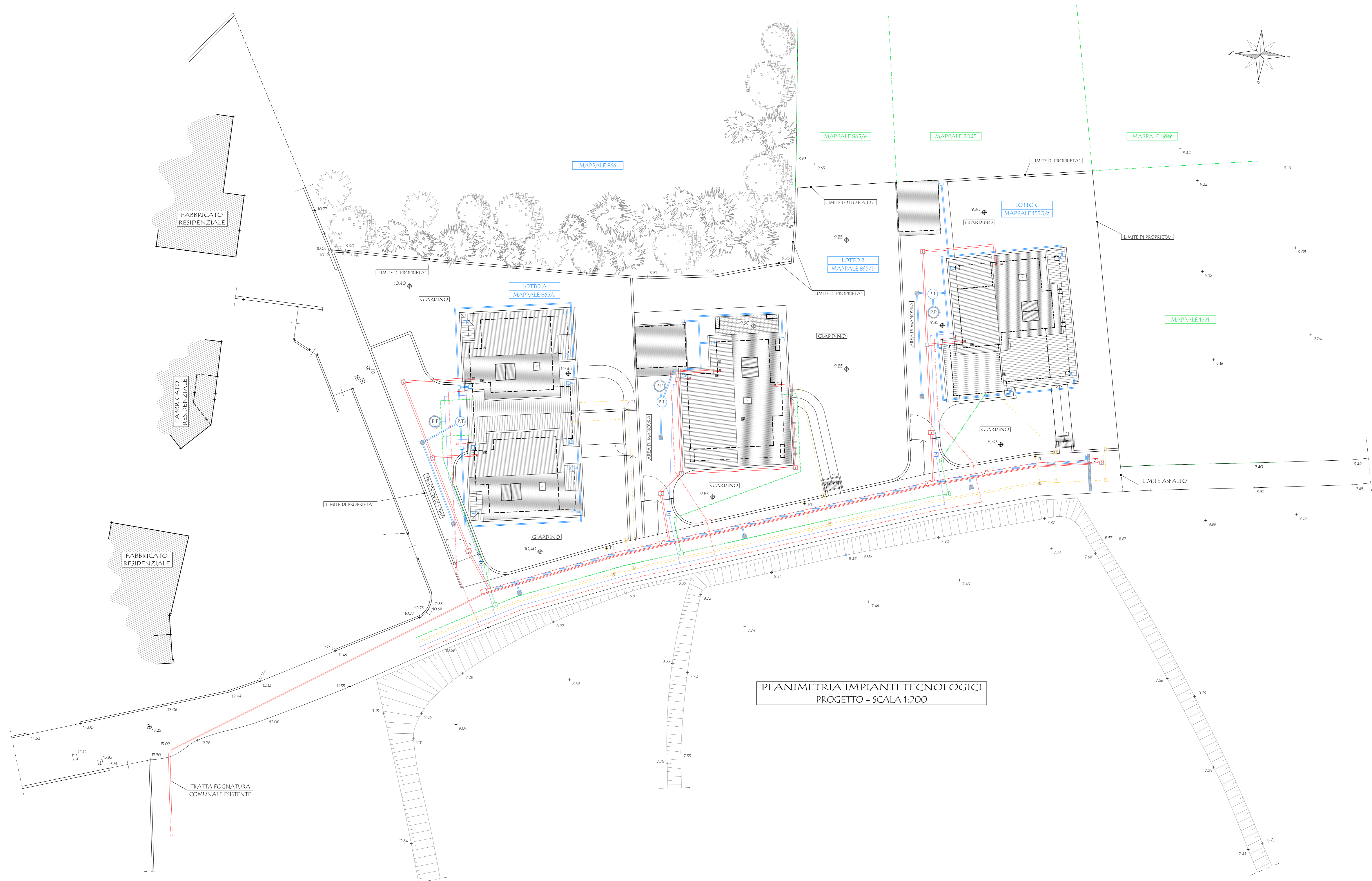
PLANIMETRIA IMPIANTI TECNOLOGICI PROGETTO - SCALA 1:200