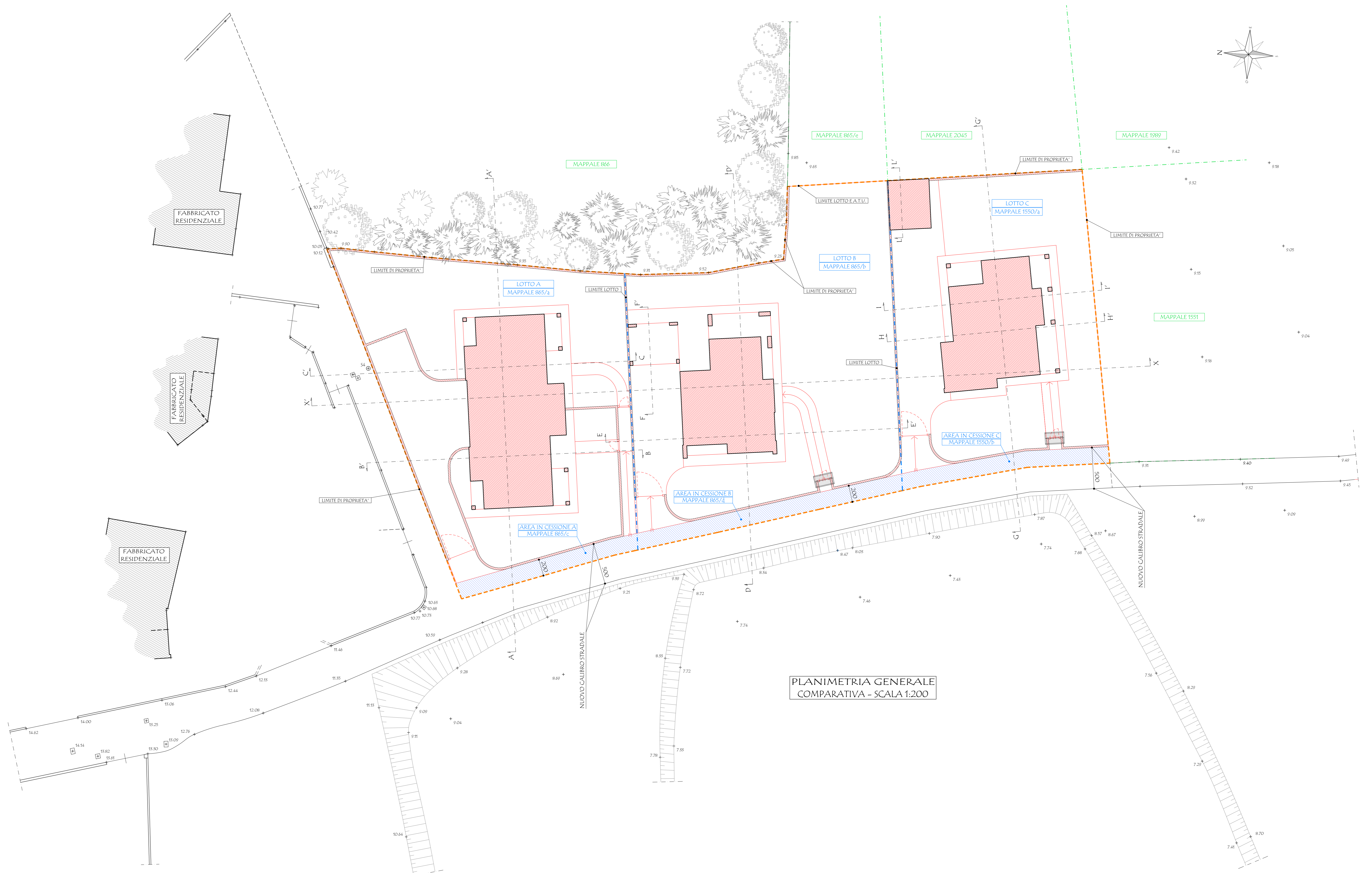
PLANIMETRIA GENERALE COMPARATIVA - SCALA 1:200