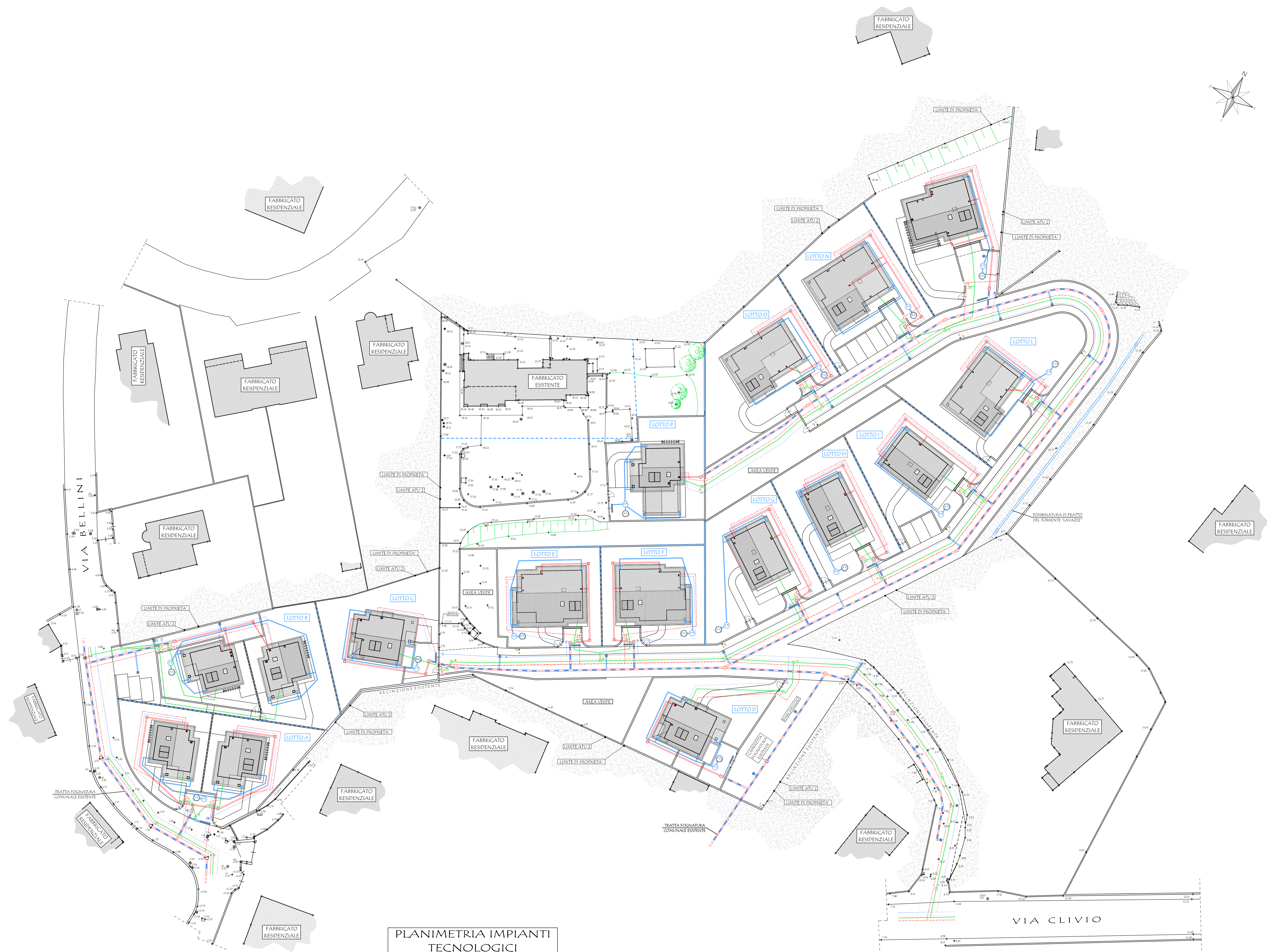
PLANIMETRIA IMPIANTI TECNOLOGICI PROGETTO - SCALA 1:400