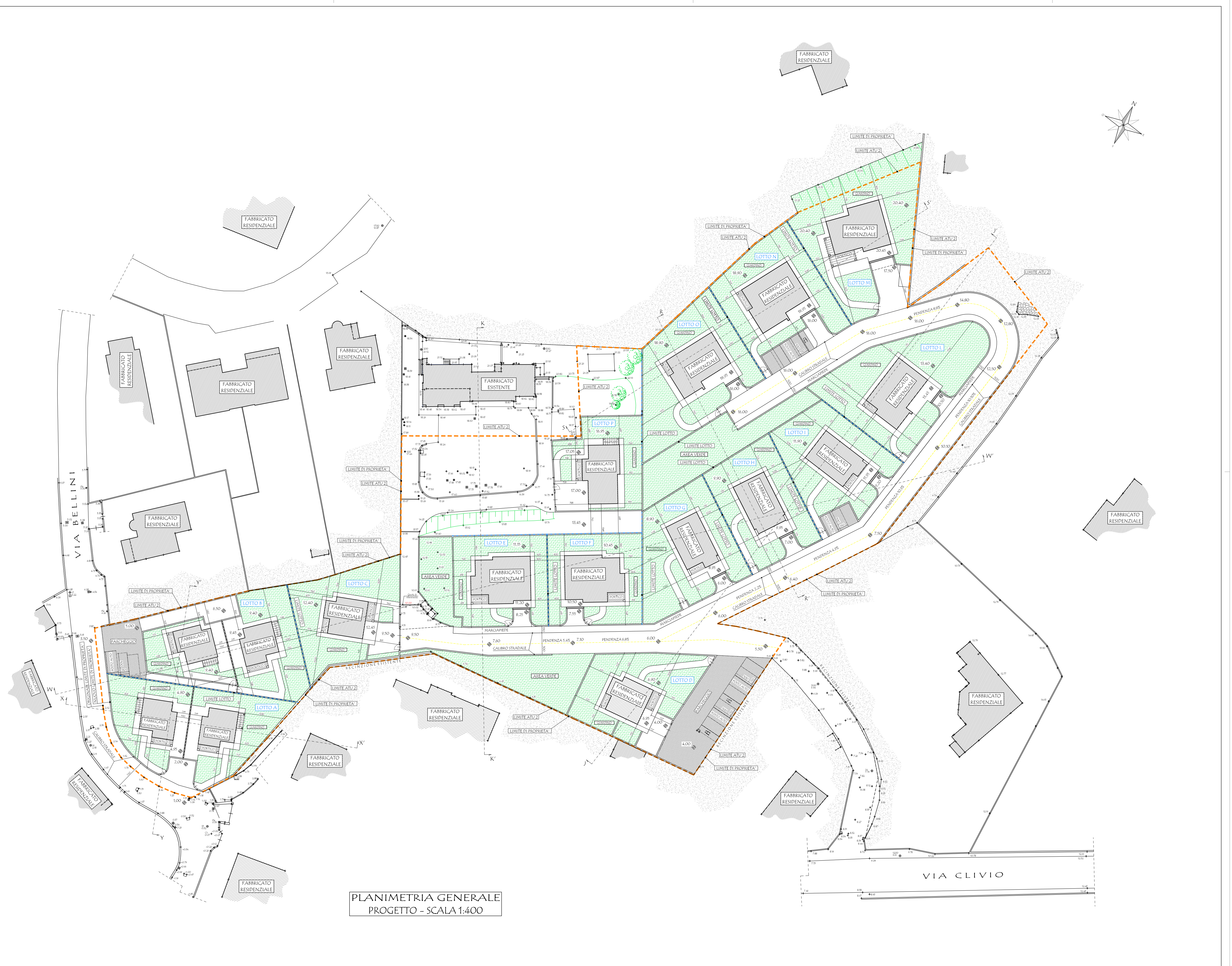
PLANIMETRIA GENERALE PROGETTO - SCALA 1:400

Località: Saltrio (VA) Indirizzo: Via Clivio - Via Bellini s.n.c. Identificativi catastali: SEZIONE: - FOLIO: 6 MAPPALE: 3354 - 3360 - 3369 - 3374 - 3708 - 3711 3385 - 3709 - 3707 - 3710 - 3705 - 3703 3371 - 3702 - 3700 - 3698 - 3696 - 3695 3697 - 3699 - 3701 - 3704 - 3706 Data: Marzo 2015